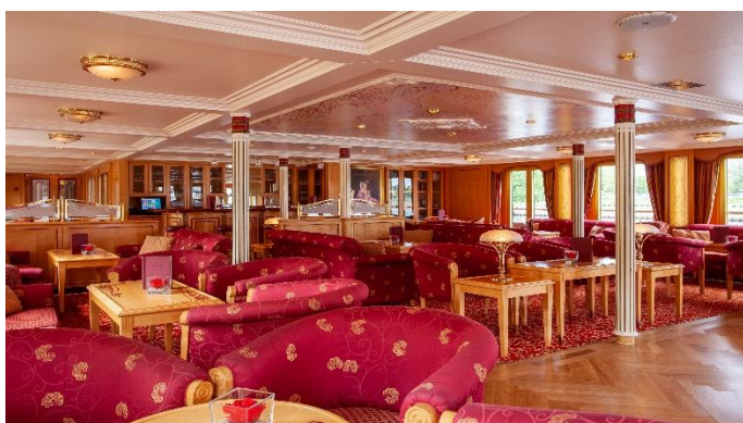
MS Chopin, Panorasalon

Bitte beachten Sie unsere Geschäftsbedingungen auf https://www.gta.at/geschaeftsbedingungen/