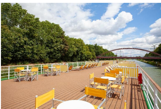
MS Chopin, Sonnendeck