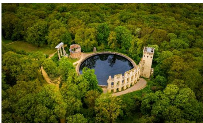
Potsdam, Park Sanssouci Ruinenberg